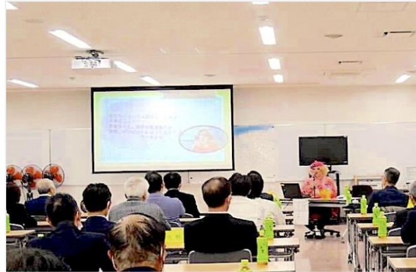
提供元：アルティウスリンク(株) (撮影2022年9月) アルティウスリンク株式会社社内開催 「LGBTQ+／SOGI (SOGIE) を学ぶ」 https://www.altius-link.com/blog/detail20230315.html